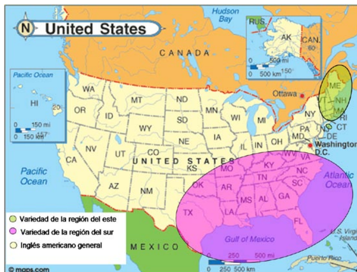
Figura 3. Mapa lingüístico de E.E.U.U.

Según la clasificación de Cruttenden (1994), en los Estados Unidos de América existen tres variedades diatópicas según las características fonológicas que comparten (Figura 3). La variedad de la región este está formada por Nueva Inglaterra y la ciudad de Nueva York mientras que la variedad lingüística de la región del sur está conformada por el área que comprende desde Virginia hasta Texas y de ahí hacia el sur. La tercera variedad, la variedad estándar, es el americano general que incluye todo el territorio restante. Si bien los alumnos a los que está dirigido este programa provienen de Nueva York, y utilizan el dialecto del este, este programa pretende abarcar una región más significativa y tener una aplicación más extensa, por eso se optó por el inglés americano general.