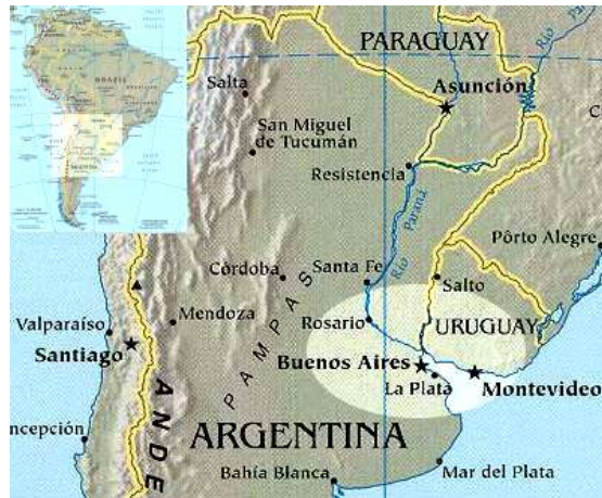
Figura 2. Zona de habla del español rioplatense.